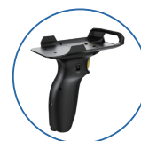
一/二维 扫描头手柄